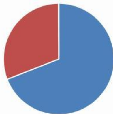
支出按政府预算经济分类